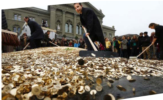
Акция в Берне (Швейцария) в поддержку безусловного базового дохода, 4 окт. 2013

Деньги на жизнь государство давало каждому, но вместе с этим оно планировало и предписывало, что именно должно производиться. Экономика и государство действовали тогда как одно целое. Однако извне организованная государственная экономика неэффективна, поскольку люди не могут проявить свой творческий потенциал. Эта проблема уходит, если на государственном уровне ввести безусловный базовый основной доход. Потому как тогда доход и работа будут рассматриваться